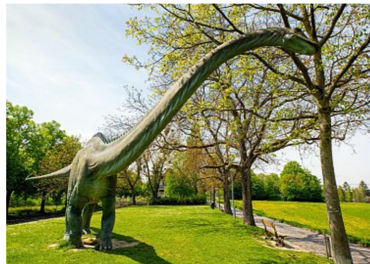
Gigantisch: Zur Bruderholz-Grünanlage gehört ein 23 Meter langer Dinosaurier.

Plump? Nein, markant! Der Wasserturm ist bis heute ein Wasserspeicher.