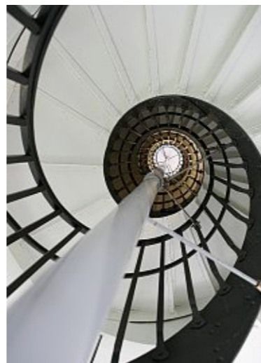
Hat den Dreh raus: Die Wendeltreppe im Inneren des Turms.